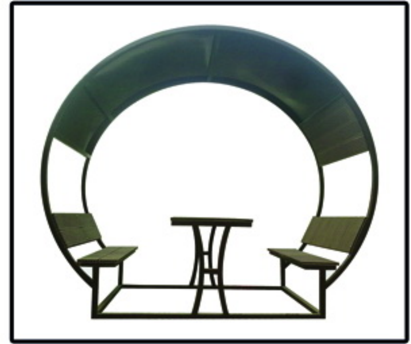
▲ الأحيق مدل آرک