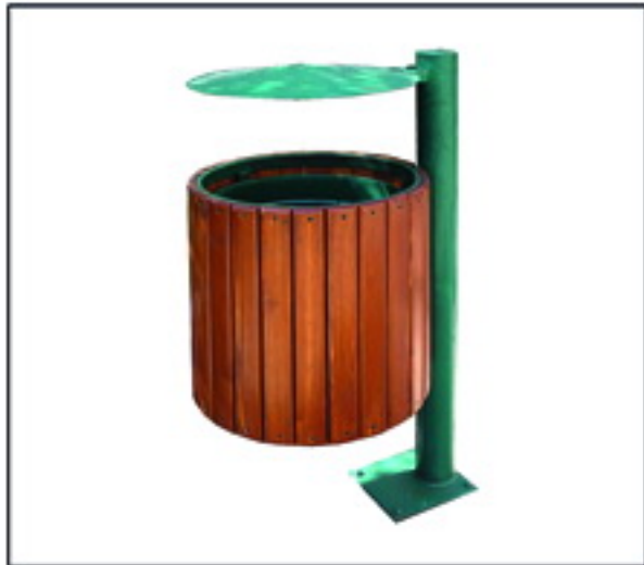
▲ سطل زباله مدل نوین مشخصات فنی

■ ارتفاع کل : ۸۶ سانتیمتر ■ ابعاد : ۳۰ x ۶۶ سانتیمتر