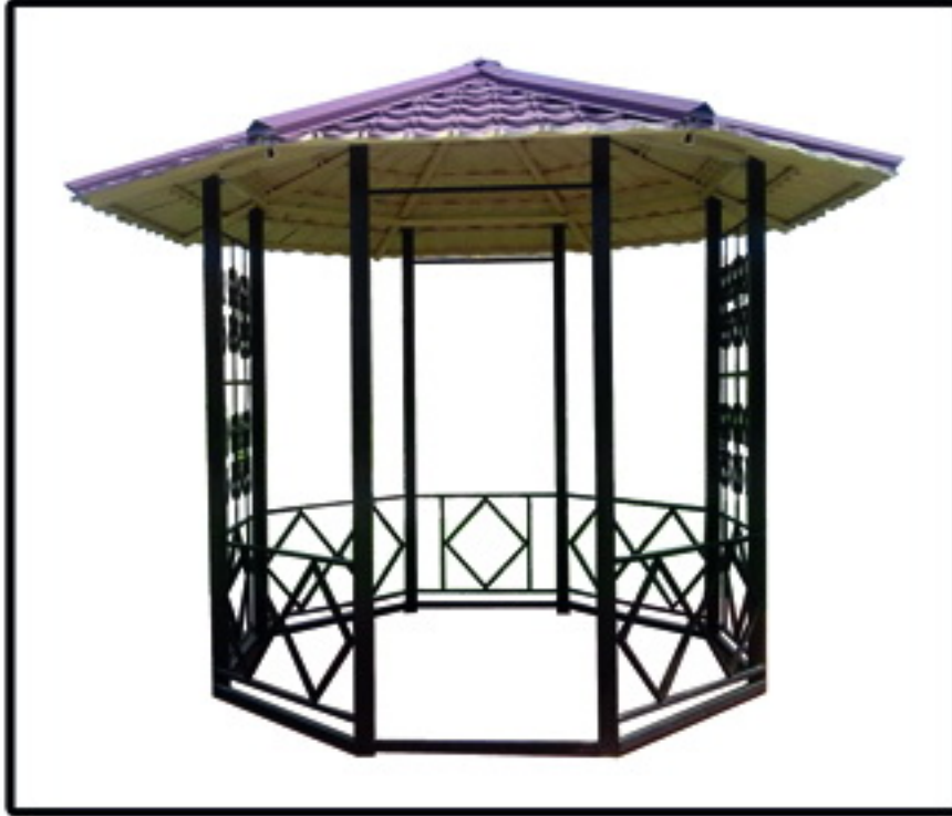
▲ الأحيق مدل مهتاب ۲