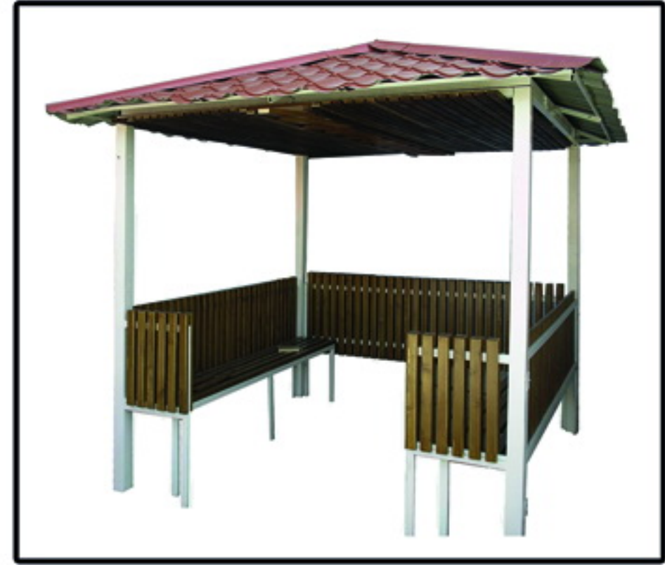
▲ الأچيق مدل نجم