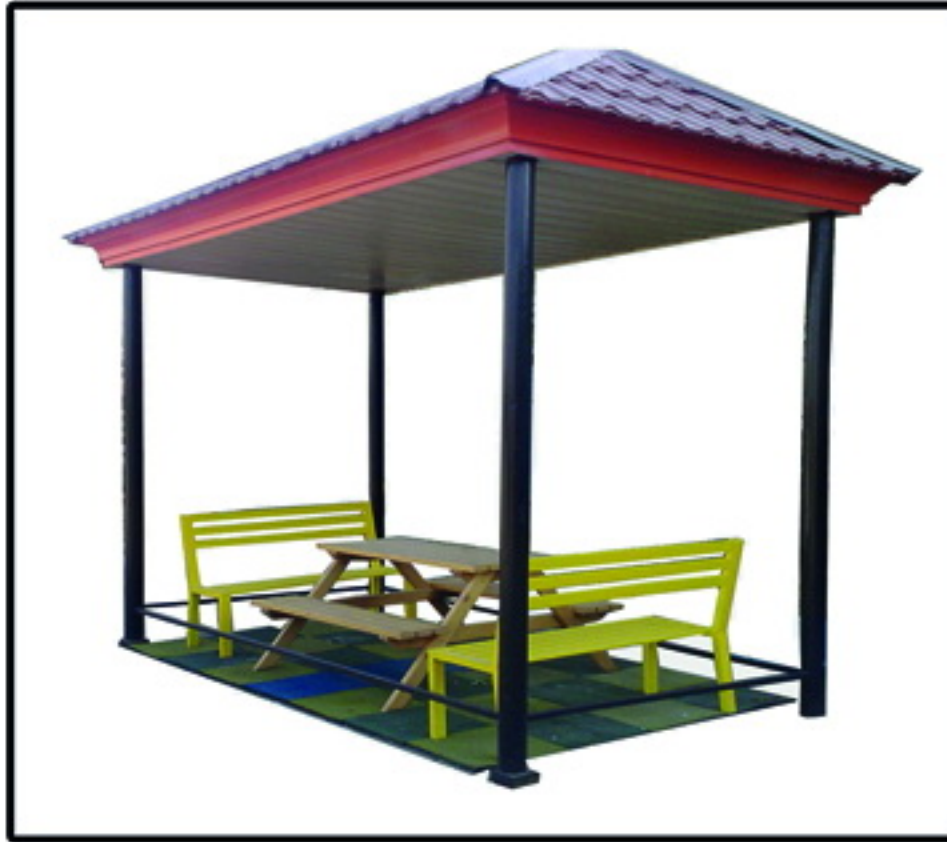
▲ الأچيق مدل مه فام