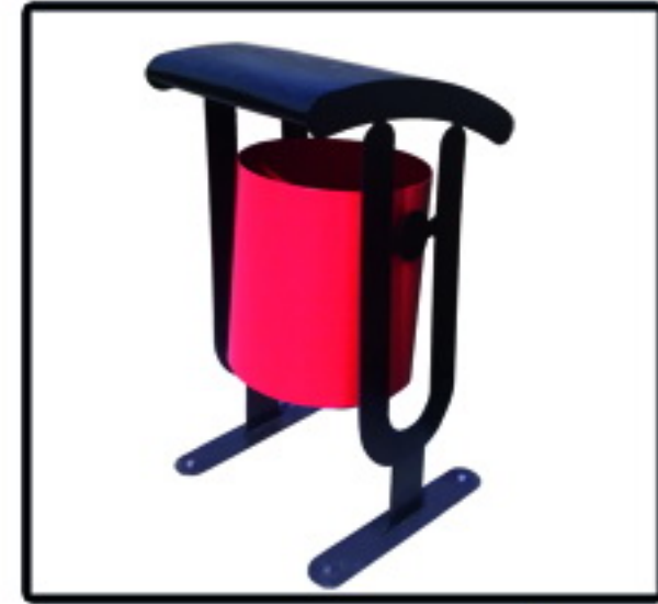
▲ سطل زباله مدل انتخابی مشخصات فنی

■ ارتفاع کل : ۵۰ سانتیمتر ■ ابعاد : ۳۶ سانتیمتر