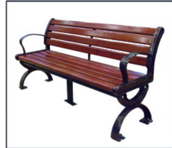
▲ نیمکت مدل آرامش مشخصات فنی

■ ارتفاع کل : ۱۰۶ سانتیمتر ■ ابعاد : قطر ۴۰ سانتیمتر