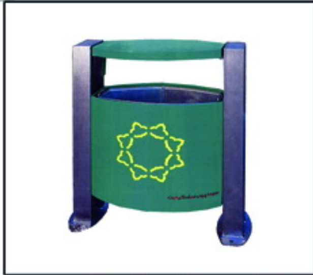
▲ سطل زباله مدل شهرداری مشخصات فنی

■ ارتفاع کل : ۸۶ سانتیمتر ■ ابعاد : ۳۰ x ۶۶ سانتیمتر