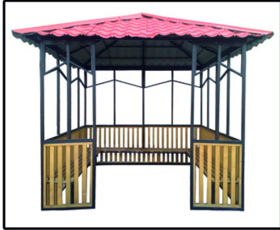
▲ ألاجيق مدل یادگار